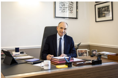
Jean-François Copé Ancien Ministre, Maire de Meaux, Président du Pays de Meaux