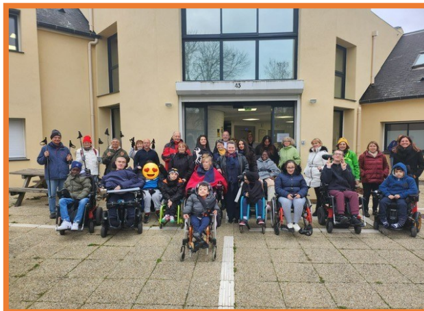
Semaine du Handicap