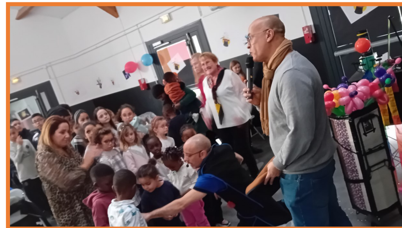
Spectacle de magie