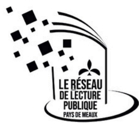
Illustration Julia Chausson ©